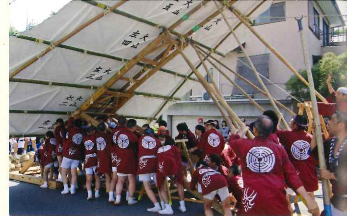
大山を上げる若衆たち