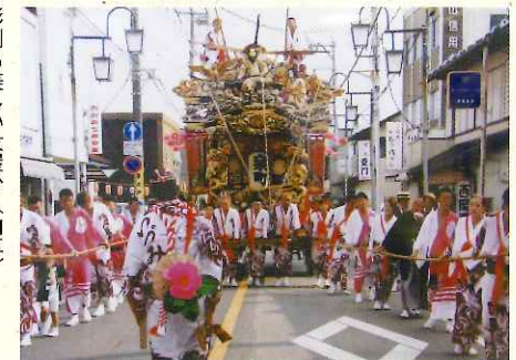
彫刻も美しい大屋台(山車)

那須烏山市最大のお祭り 「山あげ祭」を ミニチュアや映像で 年間を通してご紹介しております。